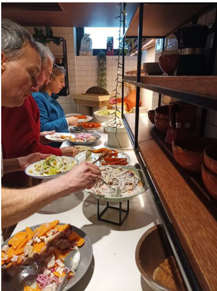
Soirée festive au Rocky-Pop