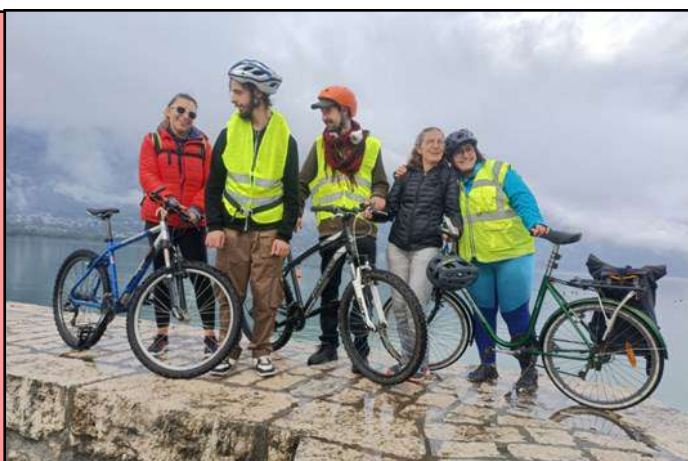
Une journée de vélo à Aix-les-Bains

Article rédigé par les résidents du Foyer Le Parc