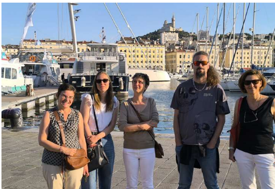
L'équipe ALHPI au 12 ème Congrès de Réh@b à Marseille

Pour répondre aux besoins d'une intervention en milieu ordinaire, et en complément des outils standardisés, les professionnels d' Elan ont également créé des outils nouveaux, comme le Plan de Prévention de Squat, et en ont adapté certains, comme le Test des Errances Multiples, qui est un outil d'évaluation des processus cognitifs.