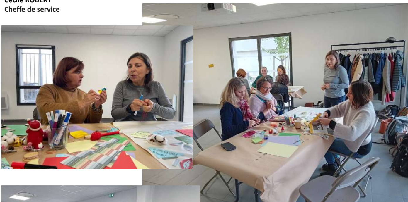
Atelier Team-building au SAMSAH Sassenage